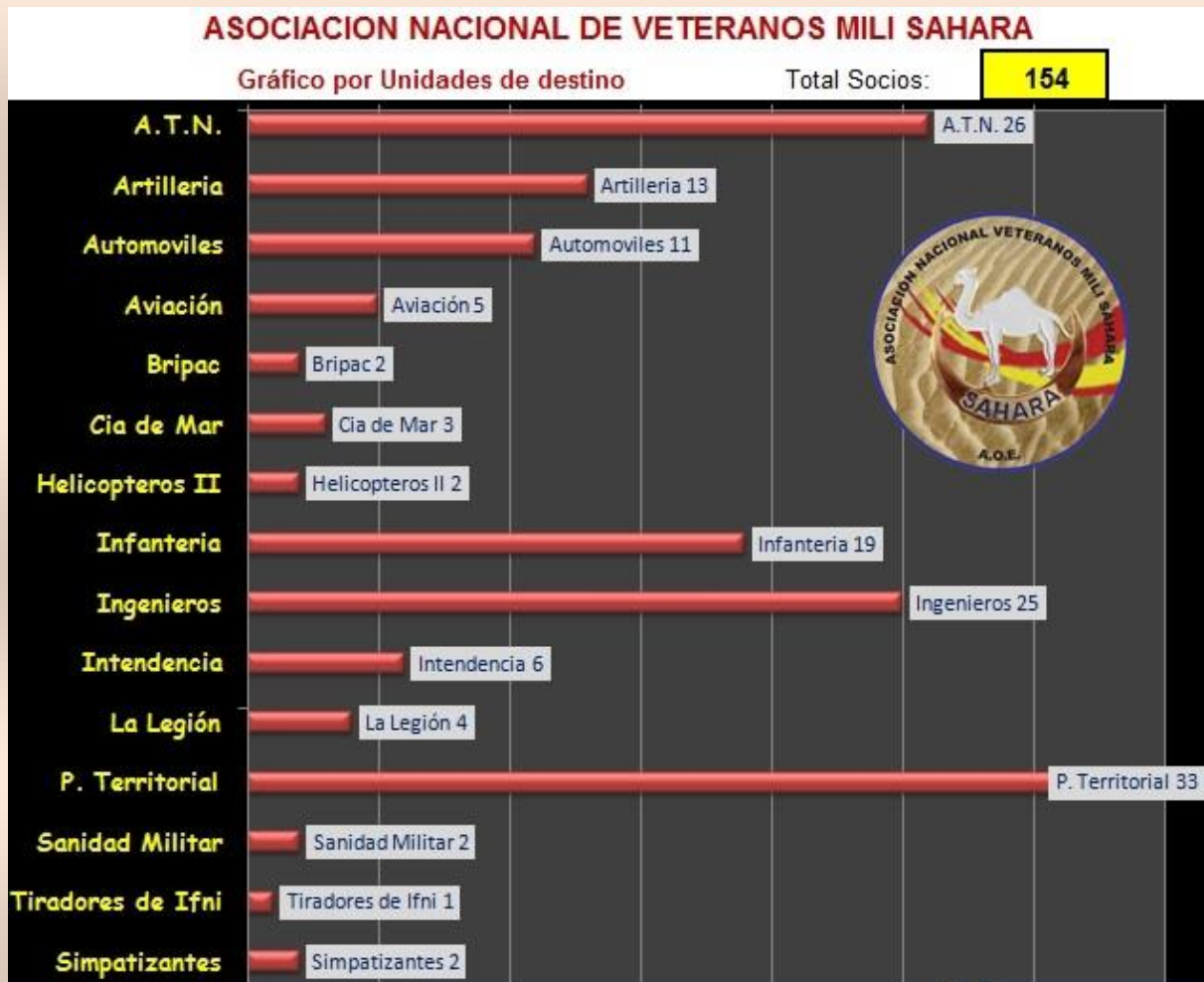
Gráfico de las inscripciones de nuevos socios, en la que se detalla por Cuerpos o Unidades de Destino, los compañeros Veteranos.