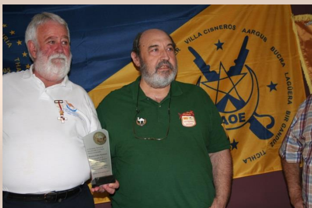
Recuerdo de parte de nuestra Asociación