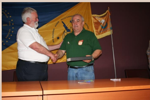
El "Grupo Aragón" también se unió al homenaje