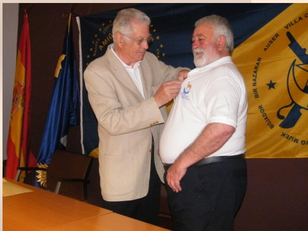
Le pone la Medalla el Presidente de ACET 4